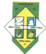
TABELA I ANEXA A LEI 801/92