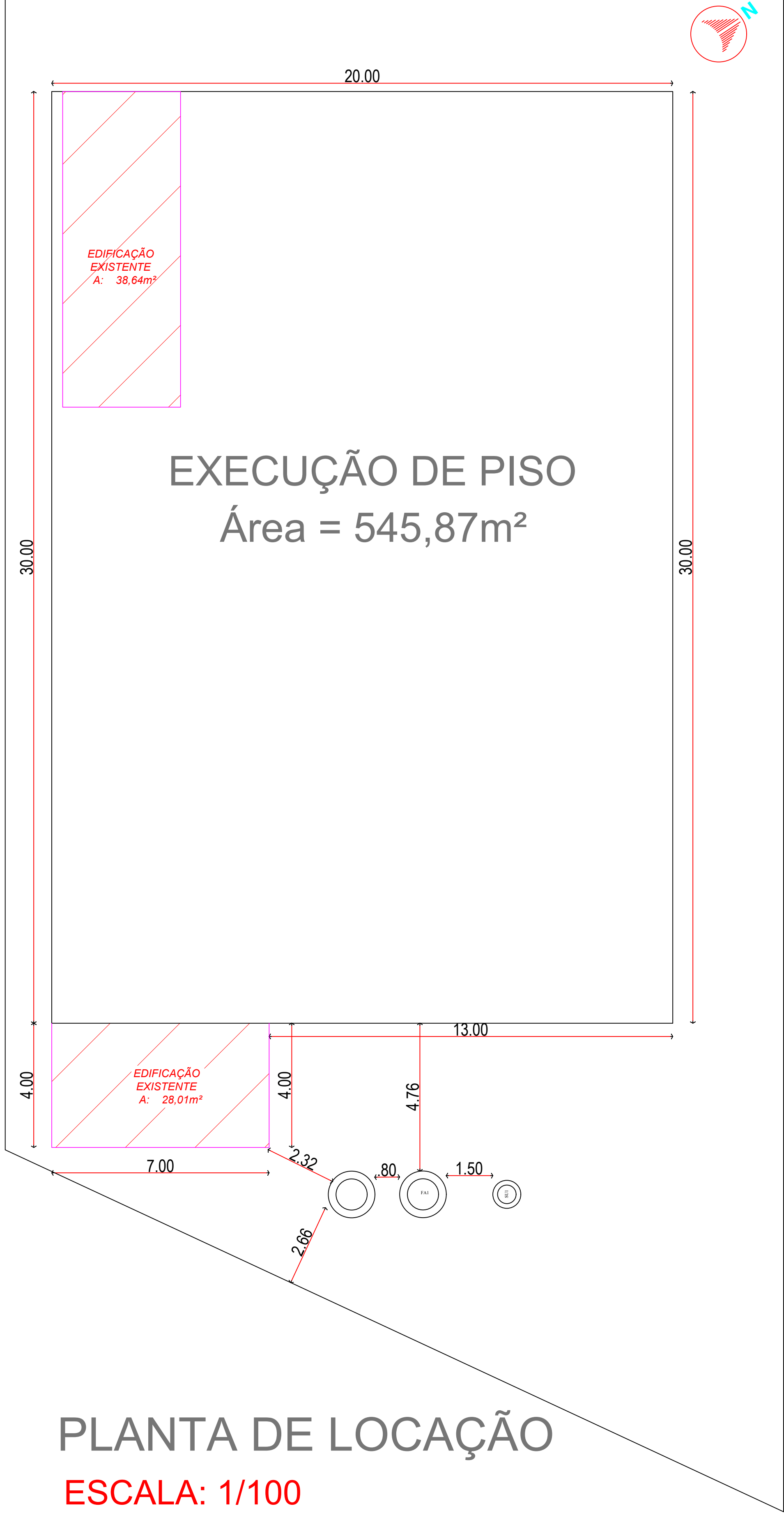
PLANTA DE LOCAÇÃO ESCALA: 1/100