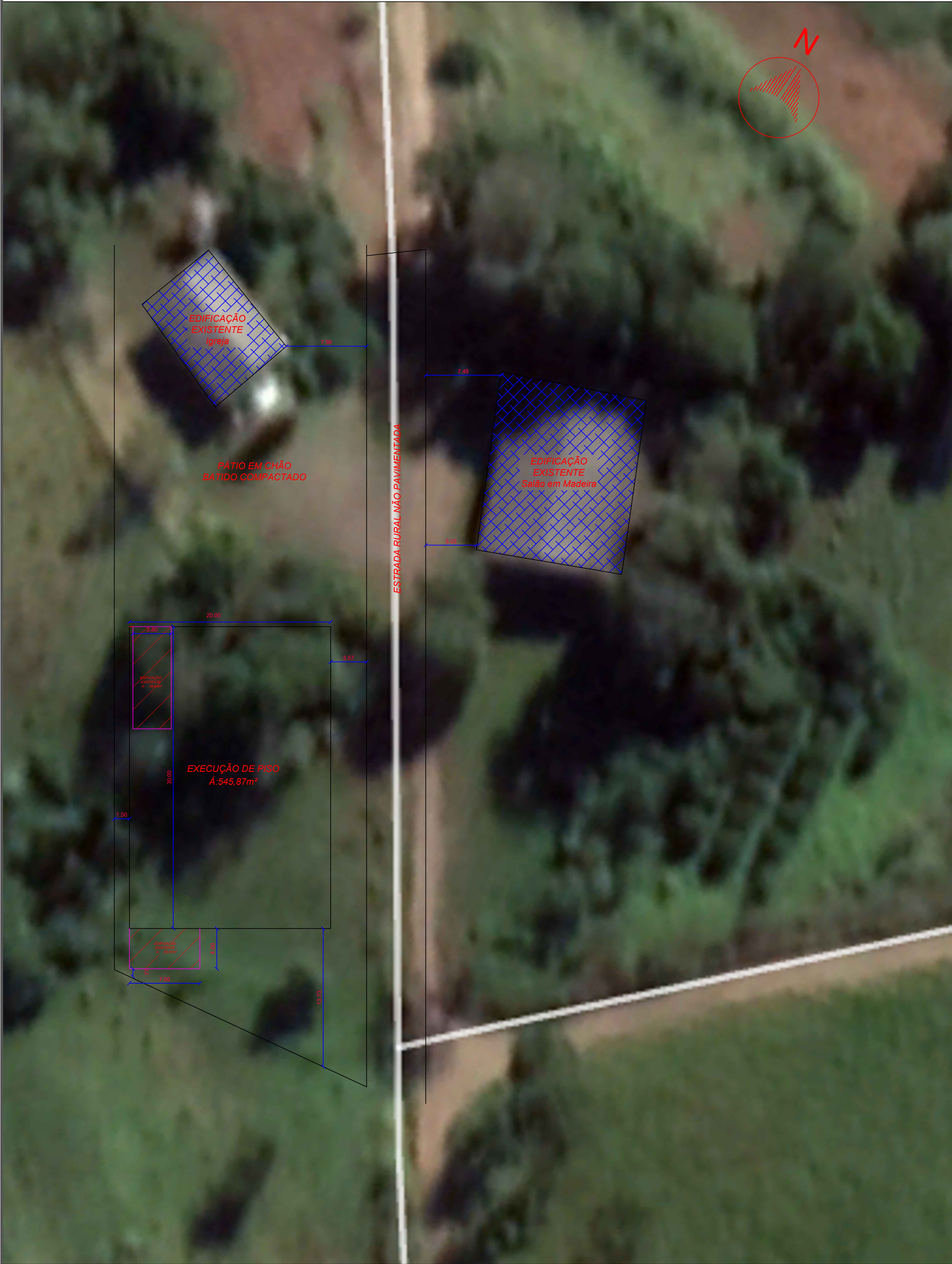
PLANTA DE SITUAÇÃO ESCALA: 1/250